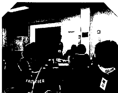
30年2月15日 樽ケアさんと 地域のケア事業者さん との交流会 風景